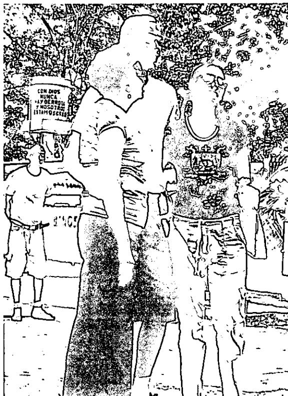
FOTOGRAFIA N° 3