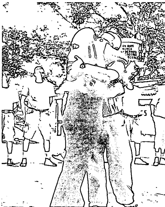
FOTOGRAFIA N° 4