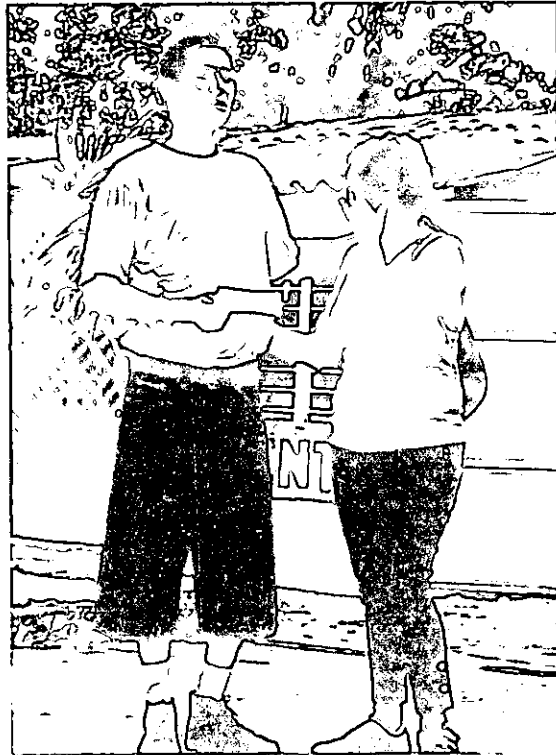
FOTOGRAFIA N° 6