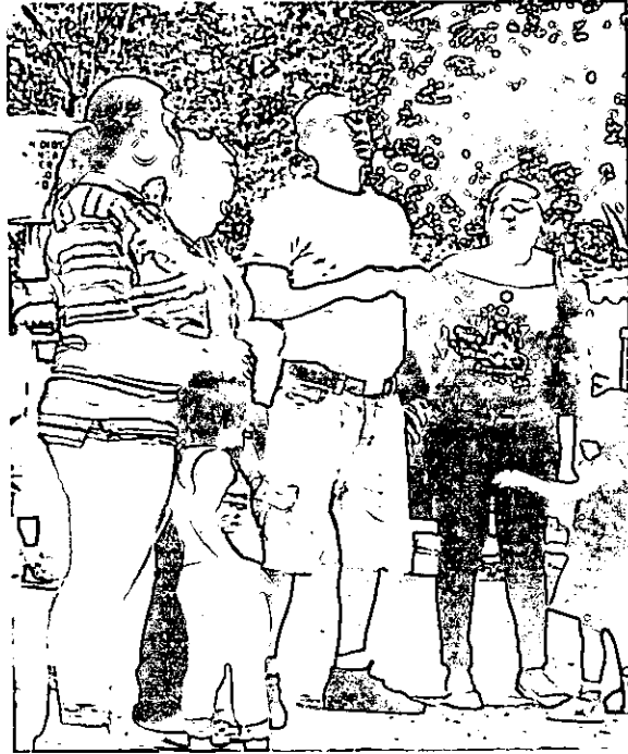
FOTOGRAFIA N° 5