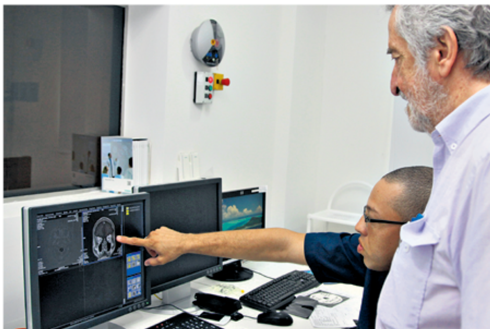
■ El FIRE cuenta con tecnología de punta para atender todas las enfermedades del cerebro como tumores, epilepsia, cisticercosis, aneurismas, trombosis, entre otras.

JFF: lo ideal es tomar al paciente con la primera crisis cuando llega por primera vez y para eso hemos creado la atención primaria en epilepsia. Eso lo pide, casi lo exige la Organización Panamericana de la Salud. Esta parte la atienden los médicos generales con cierta especialidad en epilepsia. Ese día se le hace una escanografía al paciente para descartar un tumor, cisticercosis o cualquier otra lesión e inmediatamente él tiene la potestad de iniciar el tratamiento. Hay muchas drogas para esto, pero cuando viene con varios episodios de epilepsia se hace lo mismo, si se descubre que tiene un tumor pasa inmediatamente donde el especialista, nosotros todos los días hacemos ese ejercicio.