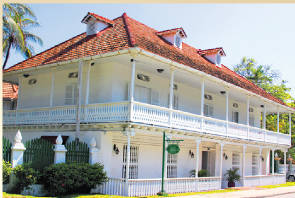
■ Casa museo Rafael Núñez en el barrio El Cabrero.

Núñez en la universidad de Cartagena El paso de Rafael Núñez por la Universidad de Cartagena fue largo e interesante. Allí, siendo aún el Colegio Nacional de Cartagena, estudio el bachillerato a edad muy temprana y luego ingresó a la facultad de Derecho de donde egresó formado