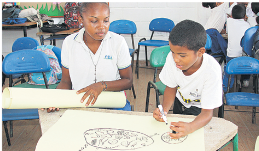
■ El Semillero de Ciencias de la Universidad de Cartagena, prepara a los estudiantes no solo para el ingreso a la Universidad, si no también para que mejoren su rendimiento durante todo el bachillerato.

Este semillero funciona en el Campus San Pablo de la Universidad de Cartagena.