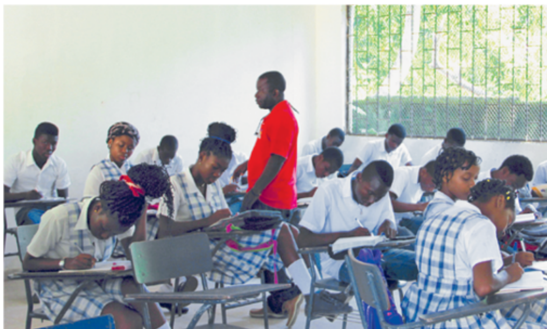
■ Para evaluar el papel de la dieta en la aparición de las alergias, el equipo de investigación conformó una cohorte con 200 niños en edad escolar descendientes de palenqueros, 100 de ellos habitan en la zona rural del corregimiento y 100 en Cartagena.

Estudios genéticos sobre la composición étnica de Palenque, realizados previamente por el Instituto, determinaron que esta comunidad cuenta con un 87 % de ascendencia africana, es decir que hay un fondo genético común que evidencia poco mestizaje; esta característica ofrece una ventaja para examinar la incidencia de los factores ambientales en la aparición de las alergias.