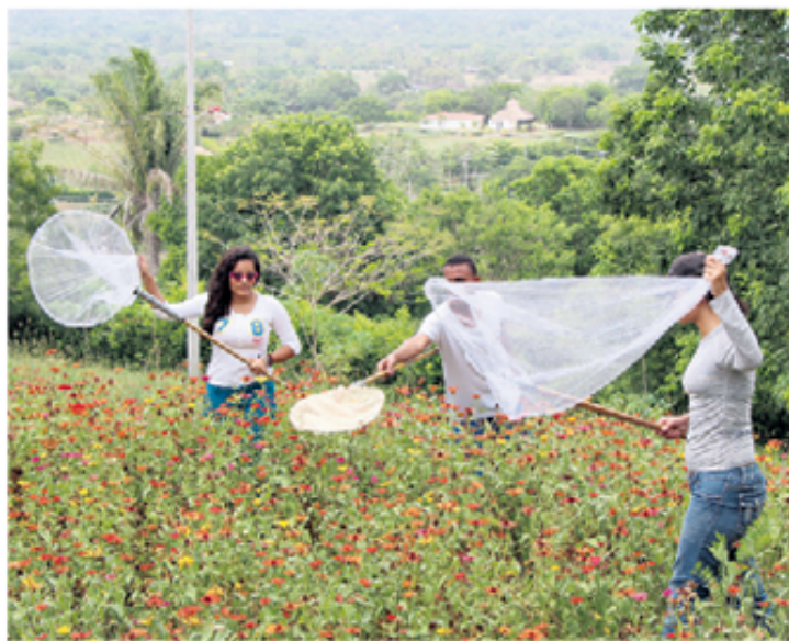
Cada mes, estudiantes del programa de Biología de la Universidad de Cartagena realizan actividades de muestreo para capturar, cuantificar e identificar las mariposas que llegan al jardín de flores Zinnia sp (margarita costeña).

Por su función ecológica, la afectación a las comunidades de mariposas tiene repercusiones sobre cultivos, pues una demora en la llegada o disminución de las poblaciones de estos insectos en un determinado lugar pone en riesgo la fertilización de las plantas.