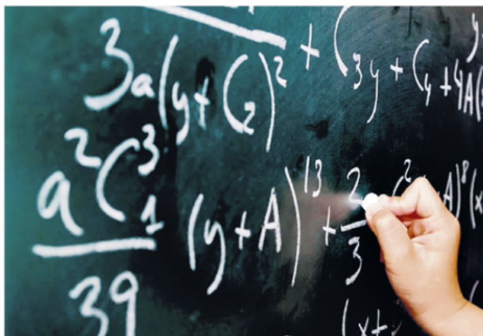
■ Para la enseñanza de las matemáticas y en general las ciencias exactas, los profesores del Semillero de ciencias utilizan metodologías flexibles.