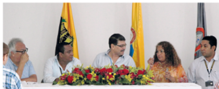
■ Directivos de la Facultad de Ciencias Exactas y Naturales en el evento de celebración del octavo aniversario de la facultad.

El 5 de junio de 2007 el Consejo Superior de la Universidad de Cartagena creó la facultad de Ciencias Exactas y Naturales. Con esta decisión institucional se reunieron en una sola facultad los programas de Química y Matemáticas, que funcionaban desde 1994, y posteriormente se crearon los programas de Biología, Técnica profesional en procesos tecnológicos y Tecnología en metrología industrial.