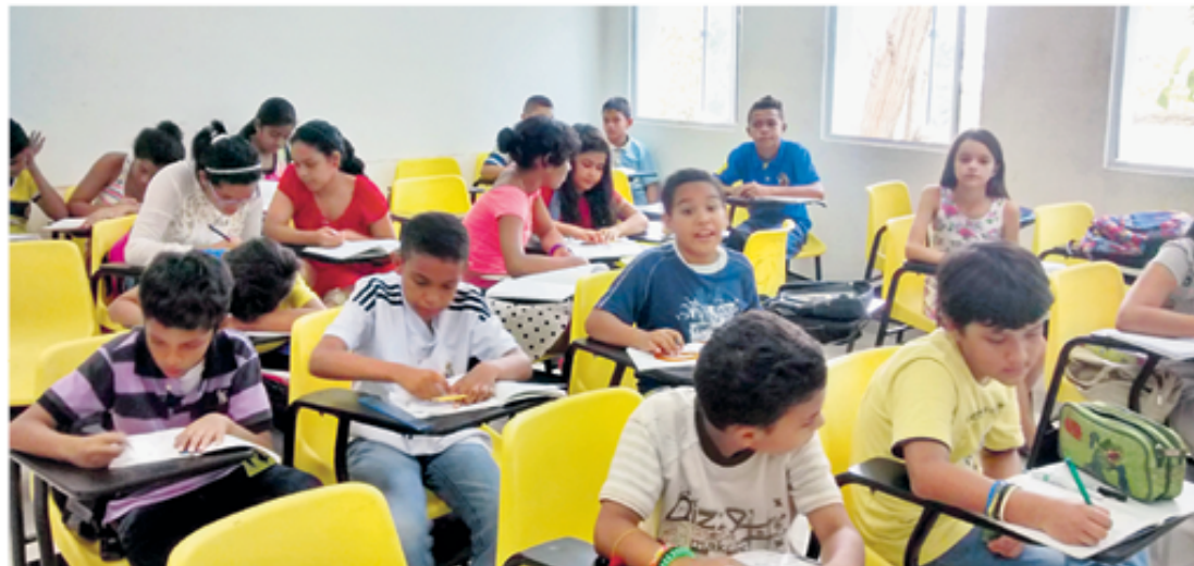
Actualmente el Semillero de Ciencias de la Universidad de Cartagena, cuenta con 535 estudiantes, quienes reciben sus clases en aulas del Campus San Pablo.