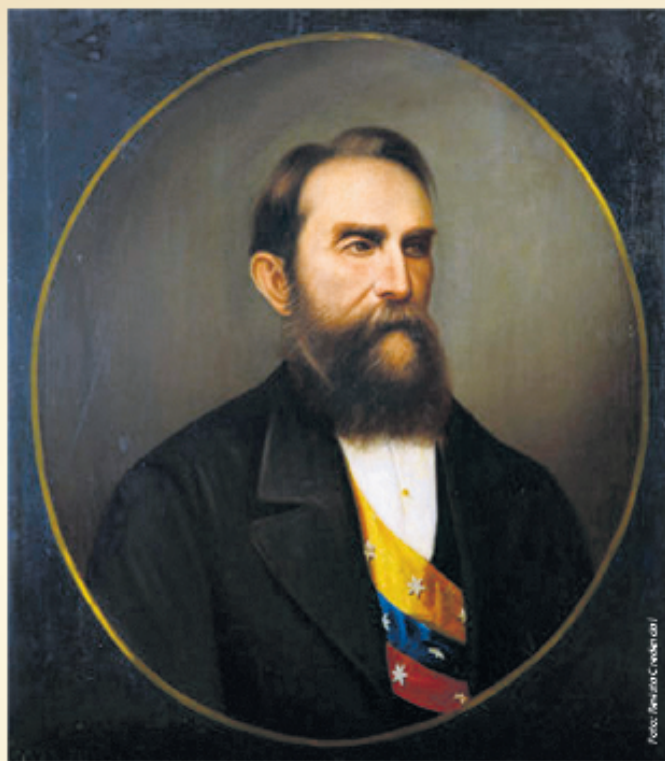
■ Rafael Núñez, cuatro veces presidente de Colombia, fue rector de la Universidad de Cartagena