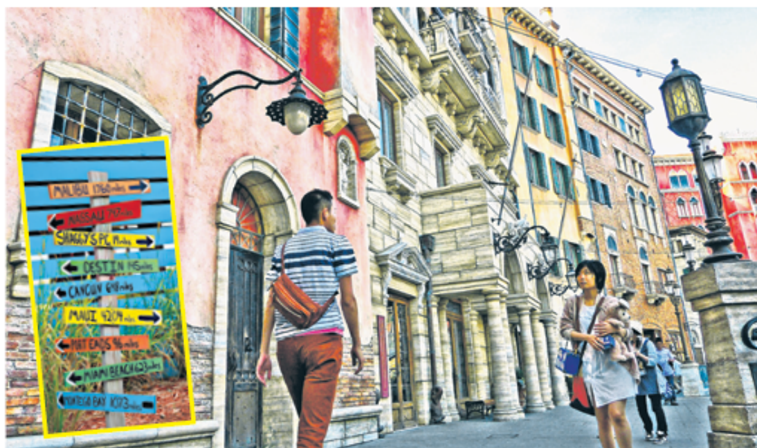
Desenvolverse en una cultura distinta a la propia es un reto que te hará crecer como profesional y como ser humano.