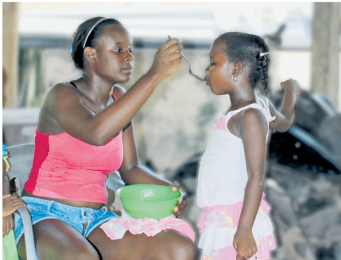
Las estudios adelantados por el Instituto de Investigaciones Inmunológicas de la Universidad de Cartagena en el corregimiento de Palenque muestran que el ambiente rural y la dieta palenquera son factores protectores en la aparición de enfermedades alérgicas en esa comunidad.