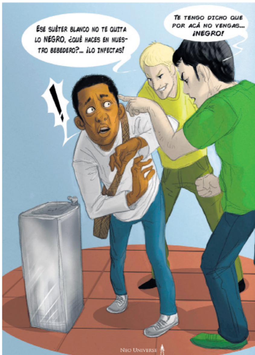
■ El 78 % de los niños y 77 % de las niñas se han visto afectados por acoso escolar, según un estudio realizado por la Fundación Plan en seis departamentos del país donde hay población afrodescendiente.

De igual manera, es primordial incentivar las conductas socialmente