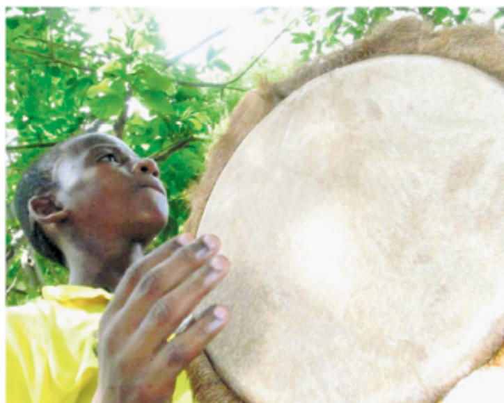
■ Ser negro aun es un problema porque se sigue concibiendo a las afrodescendientes como seres de menor valor. Algunas para defenderse suelen evitar reconocerse con su ancestralidad étnica.

son más que mitos que impiden que las personas se piensen como parte de estos pueblos acudiendo a que “nadie es puro”, lo que representa una promesa de igualdad que tiene implícita una gran carga discriminatoria.