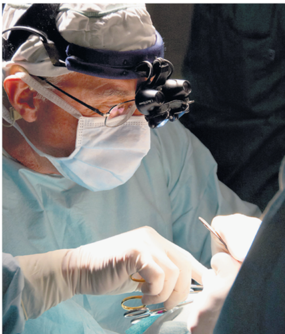
■ Las procedimientos quirúrgicos implican ciertos riesgos y complicaciones que varían en cada paciente y en cada intervención.