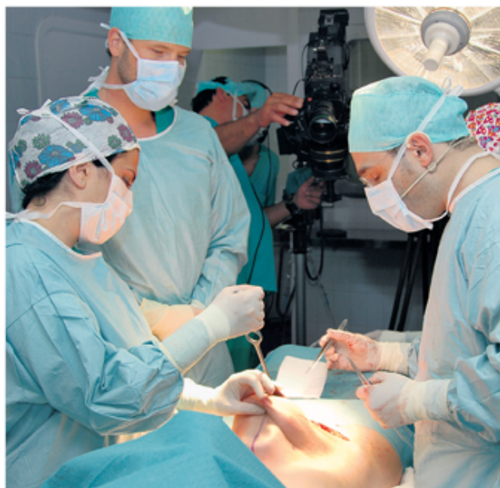
■ En los últimos 10 años en Colombia las cirugías estéticas han aumentado hasta en un 70%.

La SCCP registra un promedio de 329 lipoesculturas y 230 mamoplastias de aumento, sin contar los procedimientos estéticos en las llamadas "clínicas de garaje" que cada año arrojan cifras alarmantes de personas afectadas y/o muertas por la realización de malos procedimientos estéticos a bajos costos a cargo de personas sin los conocimientos especializados para perpetrarlos.