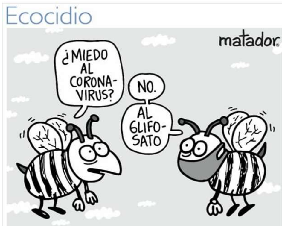
Ilustración 11: Ecocidio (2020).

En la anterior imagen publicada el 27 de agosto del 2020 titulada Ecocidio, se muestran dos abejas conversando, una tiene tapabocas y la otra no; mientras tanto la que no se muestra protegida pregunta a la otra que, si su preocupación y miedo es hacia el Coronavirus a lo que su compañera responde que no, que le tiene miedo al glifosato.