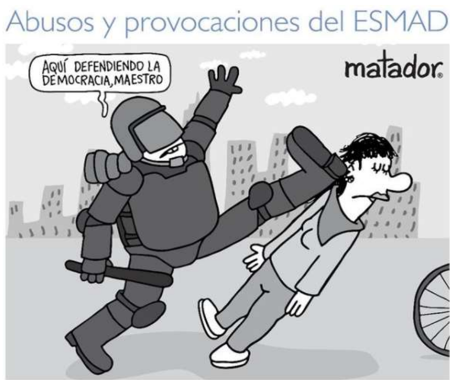
Ilustración 5: Abusos y provocaciones del ESMAD (2019). Fuente: Matador (El Tiempo).

Esta caricatura se dio como expresión de las manifestaciones que se realizaron el 21 de octubre del 2019, movimiento que marcó de manera relevante e histórica la dinámica política nacional y latinoamericana en dicho momento, puesto que en el país se dieron como un coletazo del fenómeno social ocurrido en Chile 9 , acompañando a una amplia inconformidad política y social de proporciones inimaginables, generando un estallido de marchas que se convirtió en un paro nacional que se extendió hasta inicios de 2020 (BBC News Mundo, 2019).