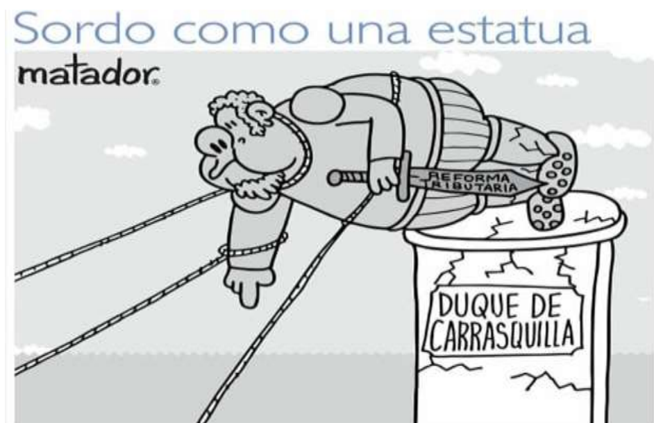
Ilustración 13: Sordo como una estatua (2021).

Esta es otra caricatura emitida en el marco del contexto de la crisis política y social que sufre Colombia en este 2021. El día 28 de abril del 2021 tras protestas y un paro nacional convocado por varios sectores sociales, un grupo de indígenas Misak derribaron la estatua de