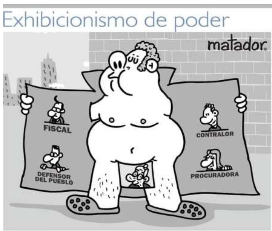
Ilustración 4: Exhibicionismo de poder (2020). Fuente: Matador(El Tiempo).

En el año 2020, ya se cumplían 2 años de gobierno del actual presidente Iván Duque, perteneciente al partido político del Centro Democrático, siendo este un partido en la mayoría de las veces criticado por parte de las caricaturas de Matador. Este año, además de marcado