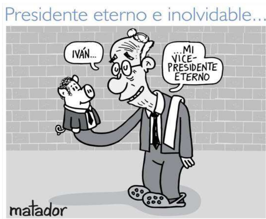
Ilustración 2: presidente eterno e inolvidable (2018).