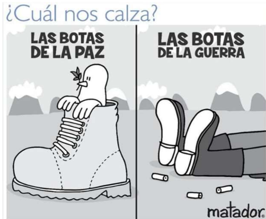
Ilustración 4: ¿Cuál nos calza? (2019). Fuente: Matador (El Tiempo).

Matador también ha plasmado su postura frente a la paz en Colombia. En 2019, publicó la caricatura “¿Cuál nos calza?” haciendo alusión a una pregunta que a la vez es una reflexión sobre la paz en Colombia, sin dejar su tono provocador.