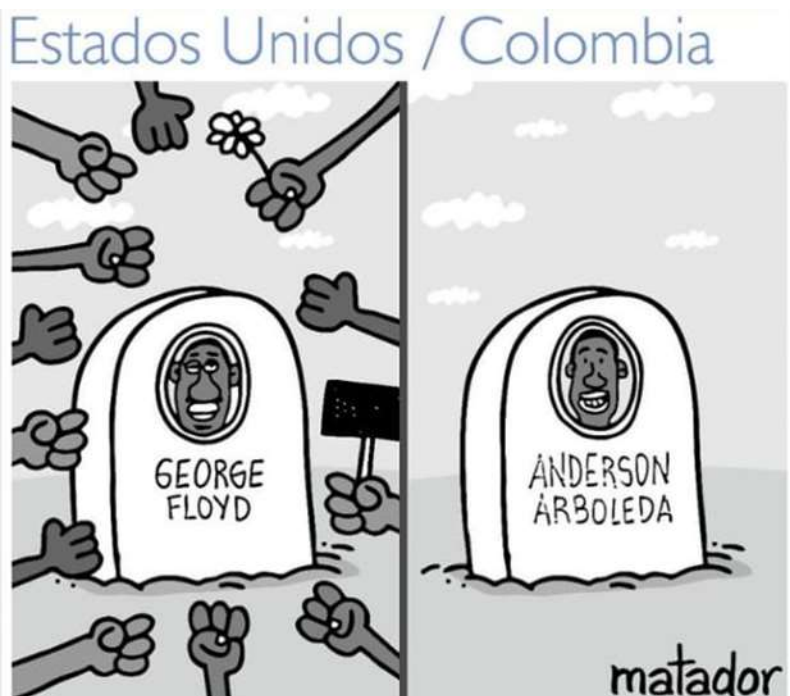
Ilustración 8: Estados Unidos / Colombia (2020). Fuente: Matador(El Tiempo).

Esta caricatura de Matador, acerca del estallido social ocurrido en Estados Unidos por la muerte del joven George Floyd, es otra muestra de los paralelismos a los que muchas veces recurre el autor, con el objeto de demostrar su punto de vista.