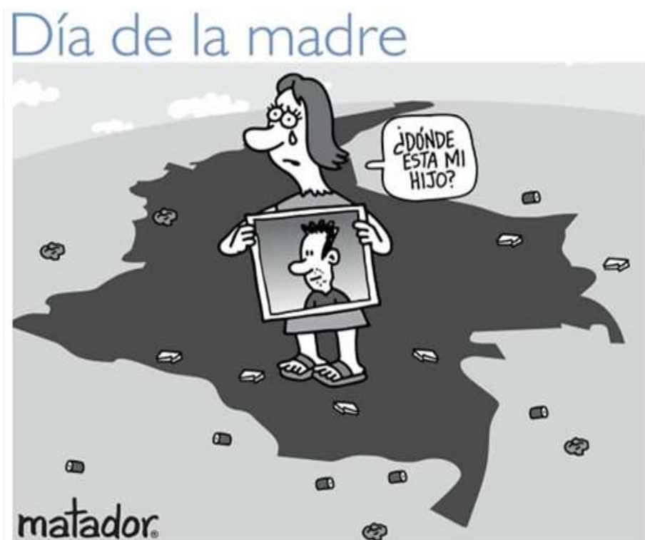
Ilustración 15: Día de la Madre (2021). Fuente: Matador (El Tiempo).

En la anterior imagen titulada “Día de la madre”, Matador hace referencia a cómo se dio en el año 2021 la conmemoración al día de la madre en Colombia, en medio de dos situaciones