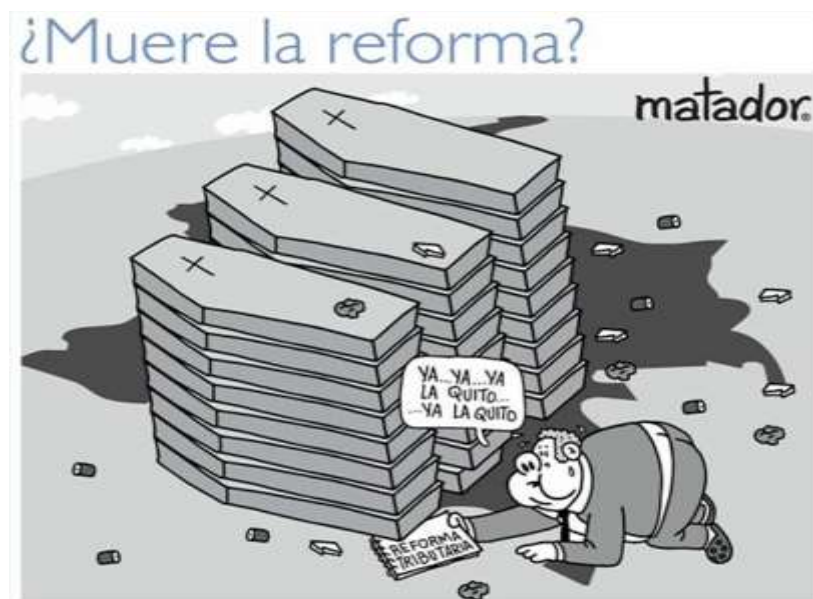
Ilustración 14: Muere la reforma (2021).

Matador también se ha manifestado en varias ocasiones sobre la histórica crisis político-social que vive Colombia. Esta caricatura titulada “Muere La Reforma”, hace referencia a la situación que se presentó tras el anuncio del retiro de la propuesta reforma tributaria por parte del gobierno, la cual generó un rechazo unánime en el país a través de manifestaciones sociales en distintos rincones del territorio nacional.