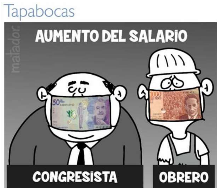
Ilustración 10: Aumento del Salario (2020). Fuente: Matador (El Tiempo).

Esta imagen es otra que se enmarca en el tema de la pandemia por el COVID-19, y muestra cómo Matador ha plasmado con su pluma distintos sucesos del País. En este caso, la presente caricatura fue publicada en el marco de las negociaciones del aumento del Salario Mínimo mensual en el país.