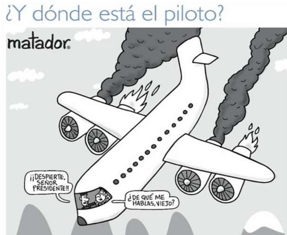
Ilustración 3: ¿Y dónde está el piloto? (2019). Fuente: Matador(El Tiempo).

En esta caricatura de 2019, Matador vuelve a realizar una crítica al gobierno de Iván Duque, pero apelando a las declaraciones realizadas a un medio local que desencadenaron una serie de críticas al mandatario: en este caso, Matador retrata a Iván Duque como el presunto piloto de un avión que se encuentra en llamas y en picada, tomado de una película norteamericana de humor titulada en español igual que la caricatura 6 ; mientras alguien, presuntamente el copiloto, le exclama “¡¡Despierte, señor presidente!!”, a lo que él responde, mientras tiene una venda en los ojos “¿De qué me hablas, viejo?”. Esta última frase hace alusión a una célebre respuesta que dio el presidente Duque a un periodista respecto de la ocurrencia de