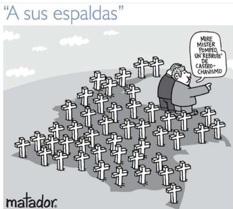
Ilustración 9: A sus espaldas (2020).