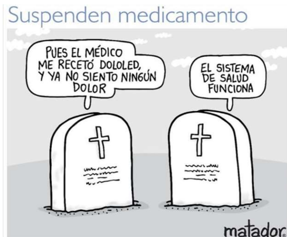
Ilustración 6: Suspenden medicamento (2020).

En este análisis se considera también necesario traer a colación la visión de Matador frente al sistema de salud, uno de los puntos más álgidos del mundo nacional.