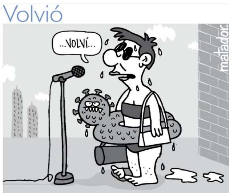
Ilustración 12: Volvió (2021).