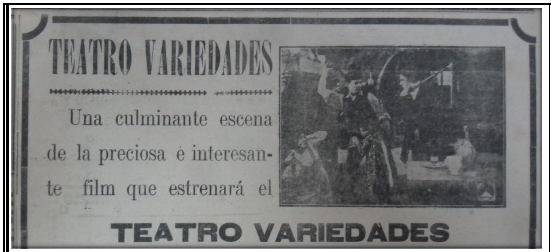
Fuente: publicidad en El Diario de la Costa 1916-1918