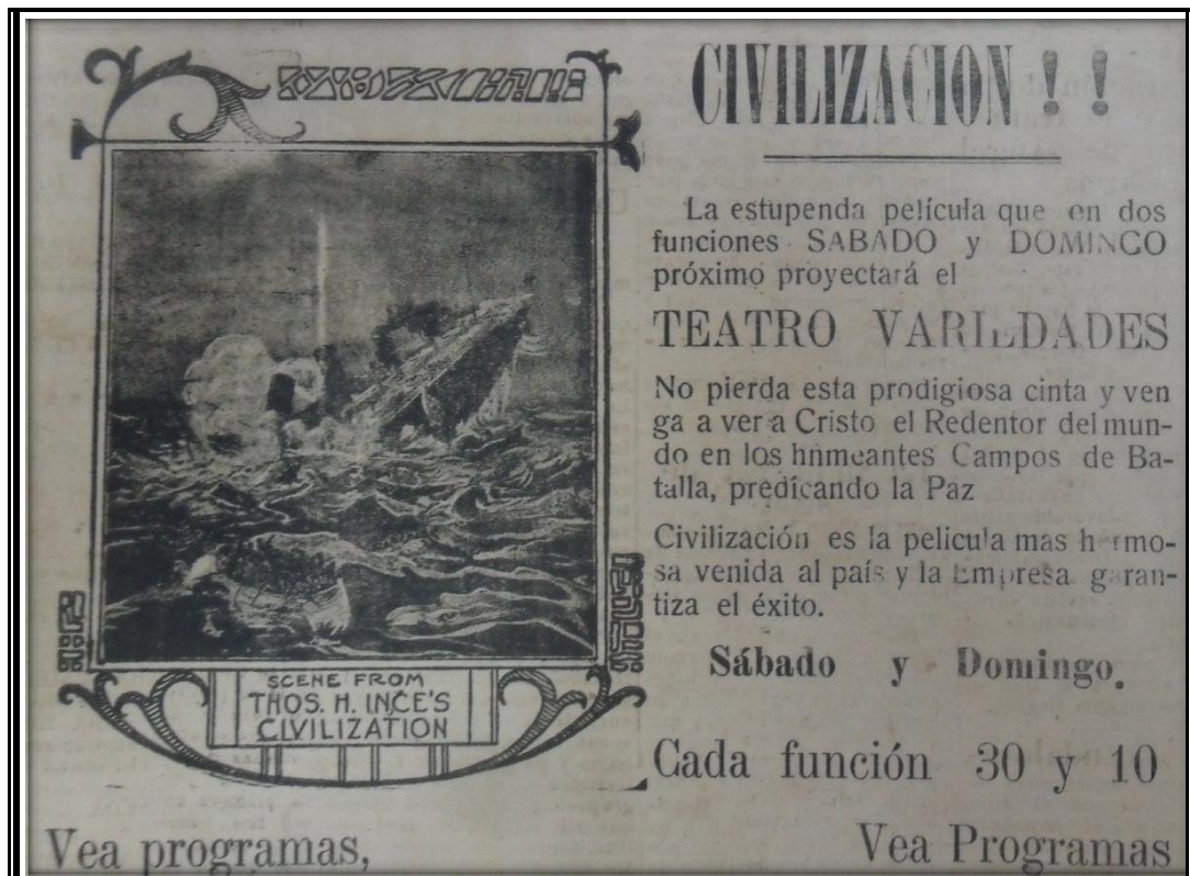
Fuente: publicidad en El Diario de la Costa 1916-1918