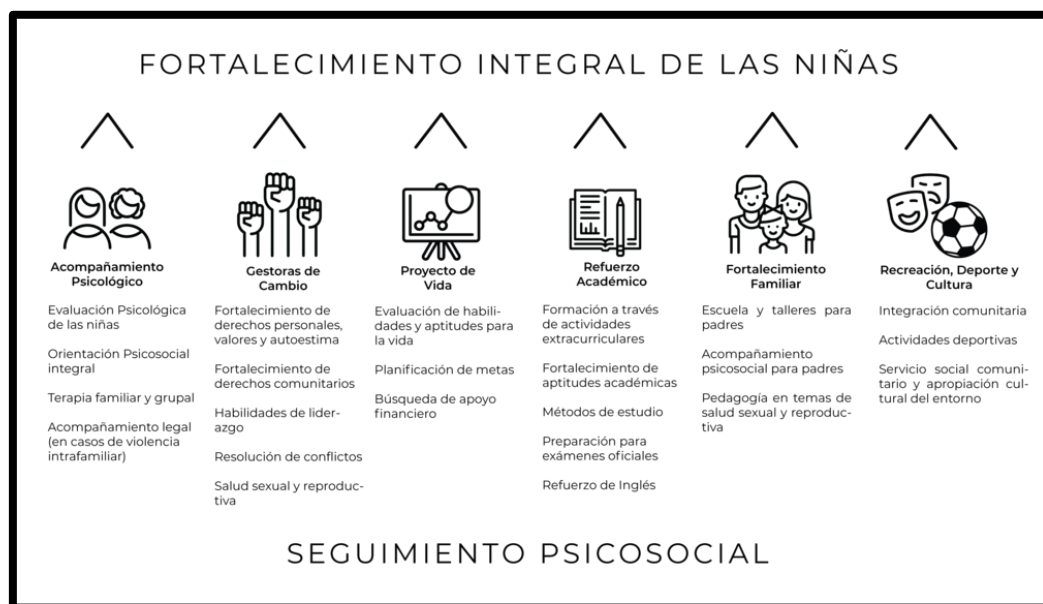
Ilustración 1 Modelo de intervención Julie

Fuente: Fundación Julie Zurek de Ardila – Modelo de intervención Julie.