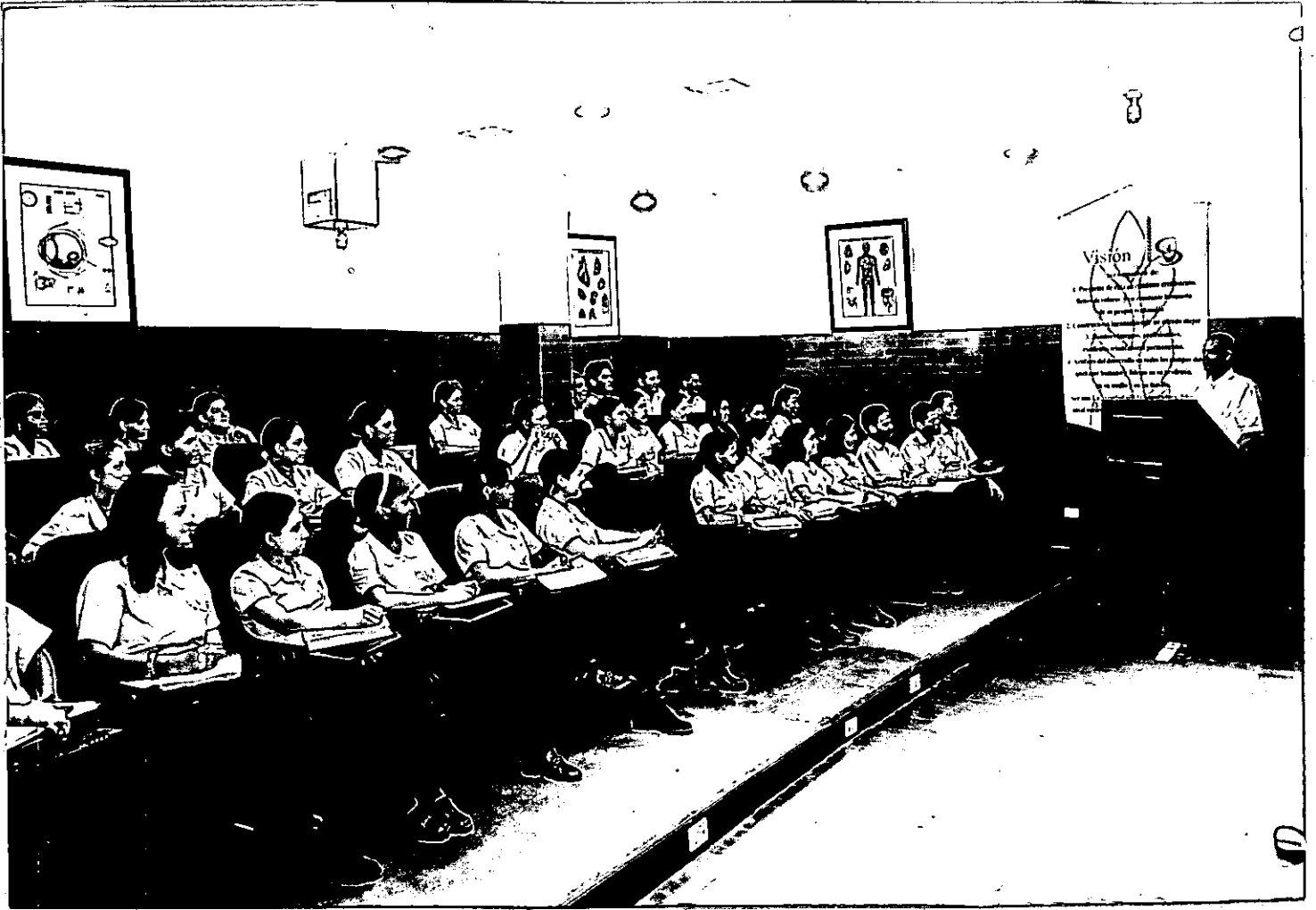
FOTO No 3 Conferencia de Anatomía como programa de la Semana Universitaria