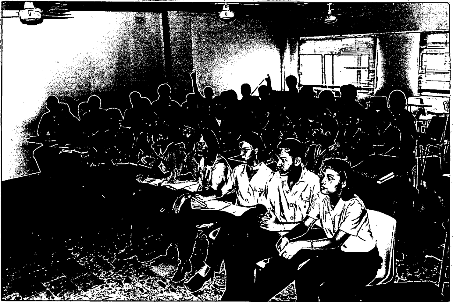
FOTO No 1 Desarrollo del taller de Educación Hacia La Tolerancia, con estudiantes de Odontología II semestre