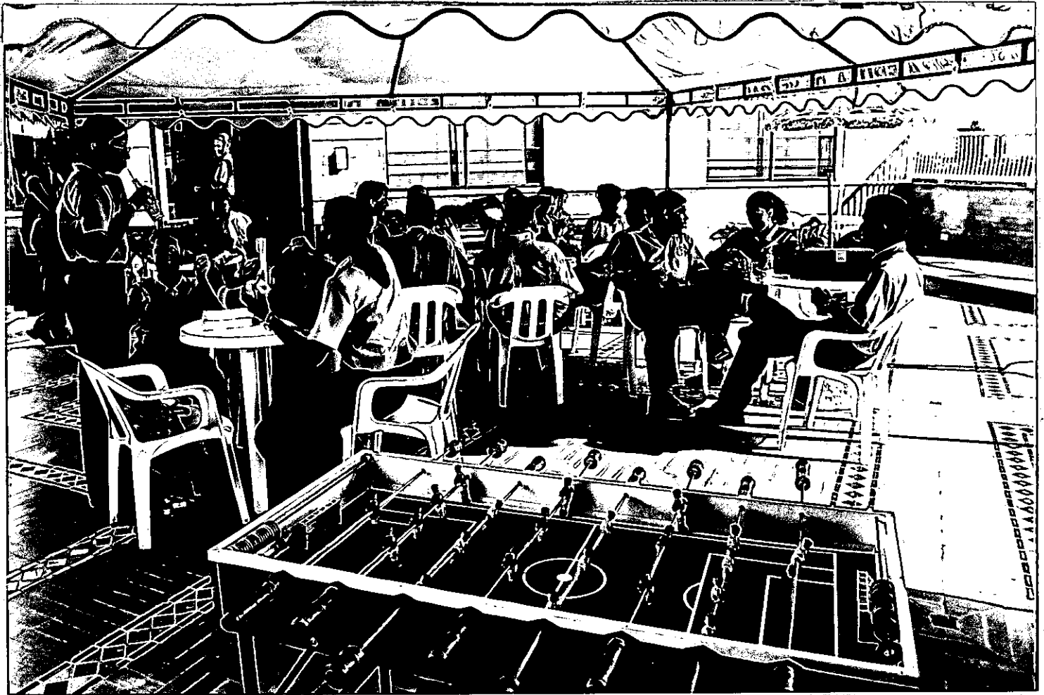
FOTO No 2 Ratos de esparcimiento de los estudiantes de la C.U.S. en la terraza del sexto piso.