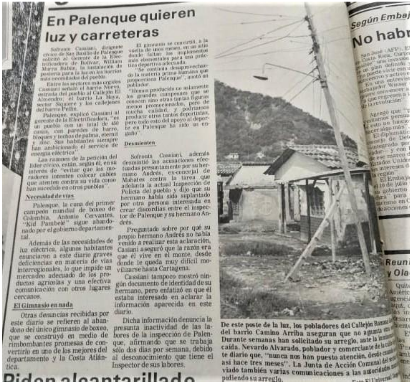
Nota: Foto sacada del universal del 21 de noviembre de 1984